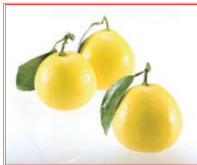
ひゅうがなつ 日向夏

約200年前に宮崎で発見され、県民に長く愛されているみかんです。ほんのり甘みのあるフワフワした白皮と、爽やかな果肉を一緒に食べることで他の柑橘にはない風味を味わえます。