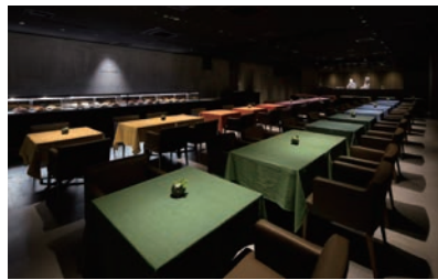
カフェコムサ 銀座店

宮崎県産のさわやかな「日向夏」と大きくて甘いきんかん「たまたま」をふんだんに使用し、マスカルポーネチーズのタルトに飾りました。宮崎県の豊かな旬のフルーツをお楽しみいただける期間限定のスペシャルタルトです。