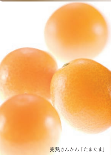
完熟きんかん「たまたま」