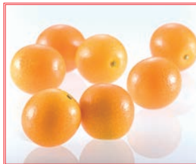
完熟きんかん「たまたま」

宮崎の完熟マンゴーのうち、糖度15度以上などの厳しい基準をクリアした厳選品が「太陽のタマゴ」です。トロピカルで濃厚な甘みは一度食べたなら忘れられない逸品です。