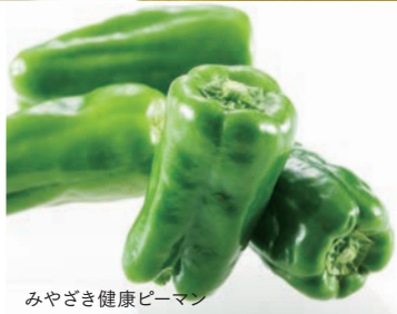
みやざき健康ピーマン