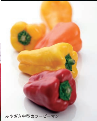
みやざき中型カラーピーマン