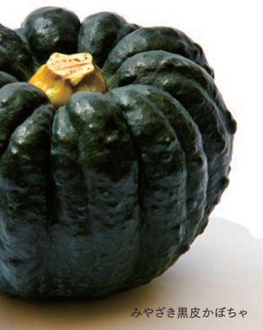
みやざき黒皮かぼちゃ