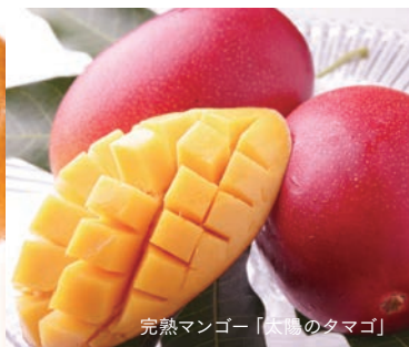
完熟マンゴー「太陽のタマゴ」